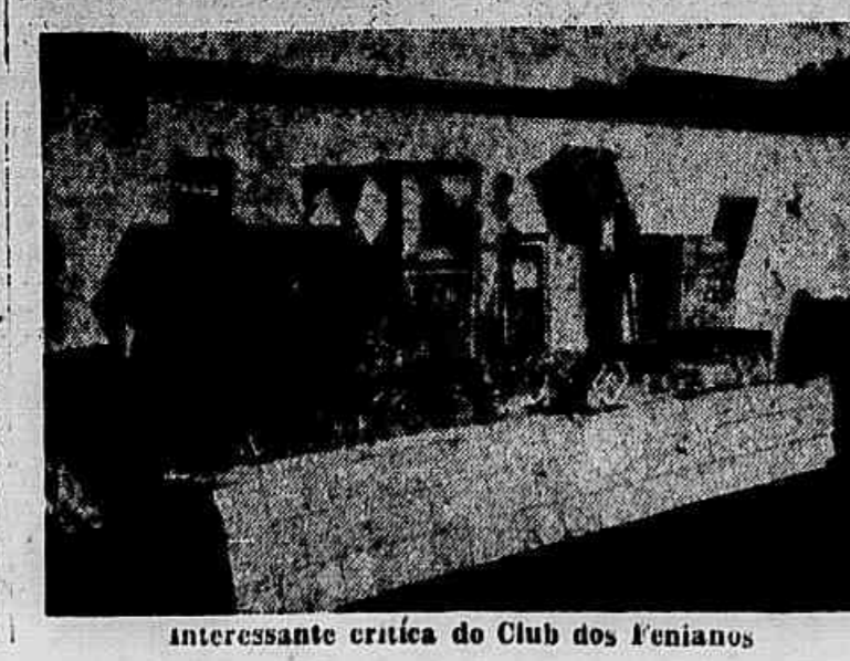
Interessante critica do Club dos Femininos